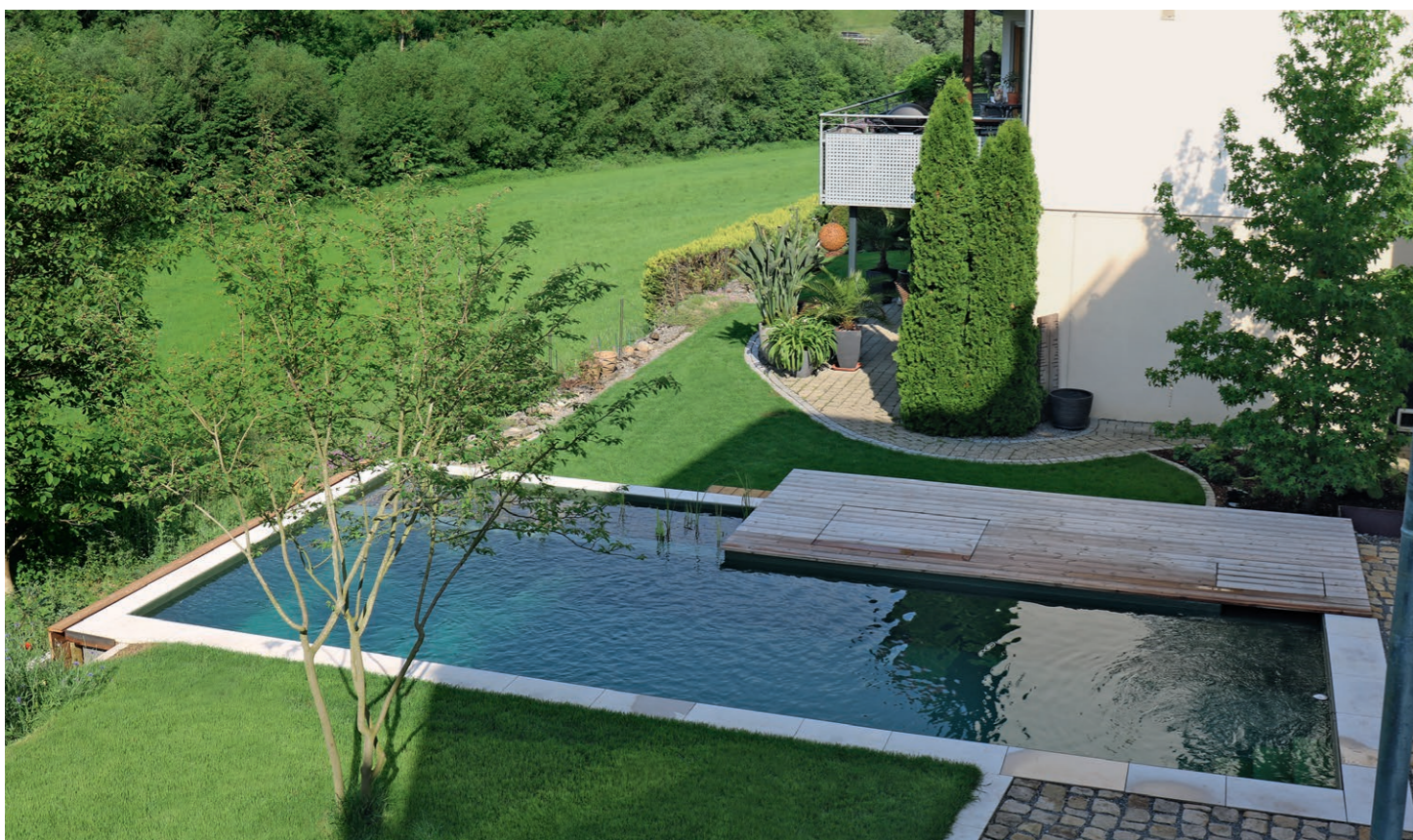
Einen wunderschönen Blick in die Natur haben die Besitzer dieses Naturpools: Für sie steht das Badegewässer in harmonischem Einklang mit der gesamten Umgebung. Er wirkt wie ein zusätzliches Stück Natur im Garten.