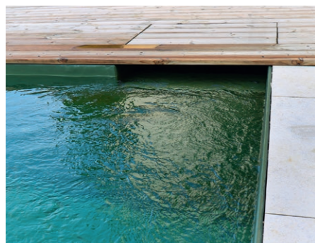
Unter dem Holzdeck aus Fichte befindet sich der Schwimmskimmer. Hier wird das Oberflächenwasser zuerst von größeren Verschmutzungen gereinigt und anschließend in den Filterkreislauf geleitet.