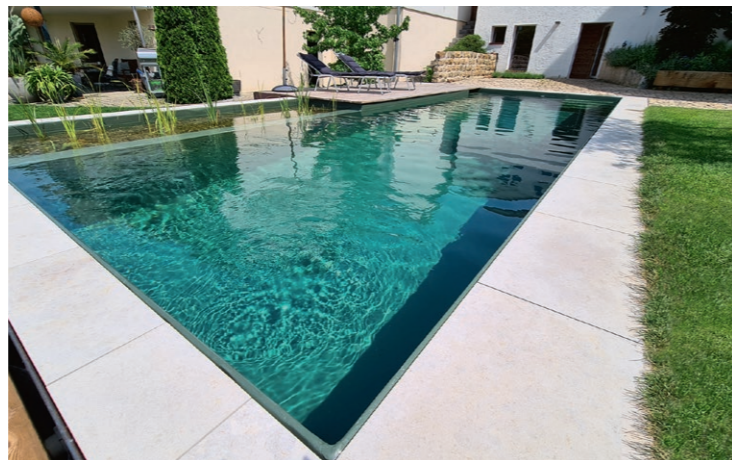
Die Flachwasserzone (linkes Bild) dient nur der Dekoration, um den natürlichen Charakter des Naturpools zu betonen. Gereinigt wird das Wasser in zwei verschiedenen, oberflächlich nicht sichtbaren Kreisläufen.