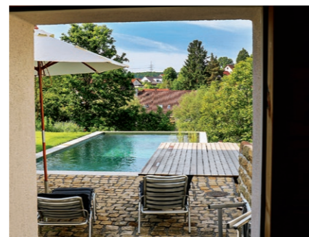
Aus der Außensauna heraus können die Benutzer auf den Naturpool und die idyllische Gegend schauen. Die Sauna ist dort entstanden, wo früher die Hühner die Frühstückseier der Hausherrn legten.